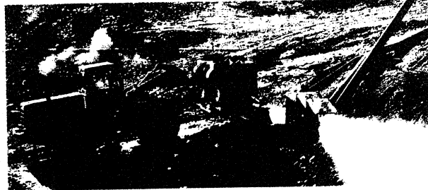
金價看俏，礦量豐富的俄羅斯已吸引了不少國家級企業投資其礦業，成為出口黃金的大國。