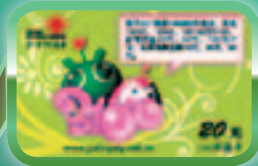
Virtual Game Cards