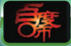
PICC's Travel Accident Insurance