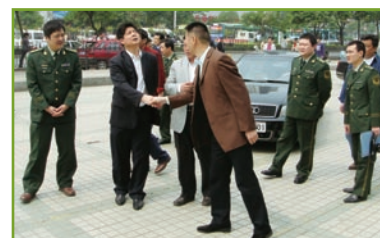
襄樊市政府官員到訪檢查湖北神州運業的工作

於二零零九年三月三十一日，該附屬公司由本集團擁有100%（二零零八年：100%）權益，曾為國營企業，擁有一個長途巴士客運站，附有92條（二零零八年：95條）巴士路線，車隊共有240輛（二零零八年：275輛）巴士，主要於湖北省經營長途巴士服務。於國營企業改革計劃下，該附屬公司已成功精簡其人力資源架構，因而使其競爭力大大獲得提升。由於就若干長期結欠應收款項及稅項作出龐大撥備，年內，該附屬公司錄得虧損約5,100,000港元（二零零八年：溢利2,600,000港元）。