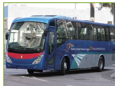
機場接駁服務巴士