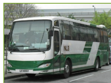
嶼巴的新型號巴士