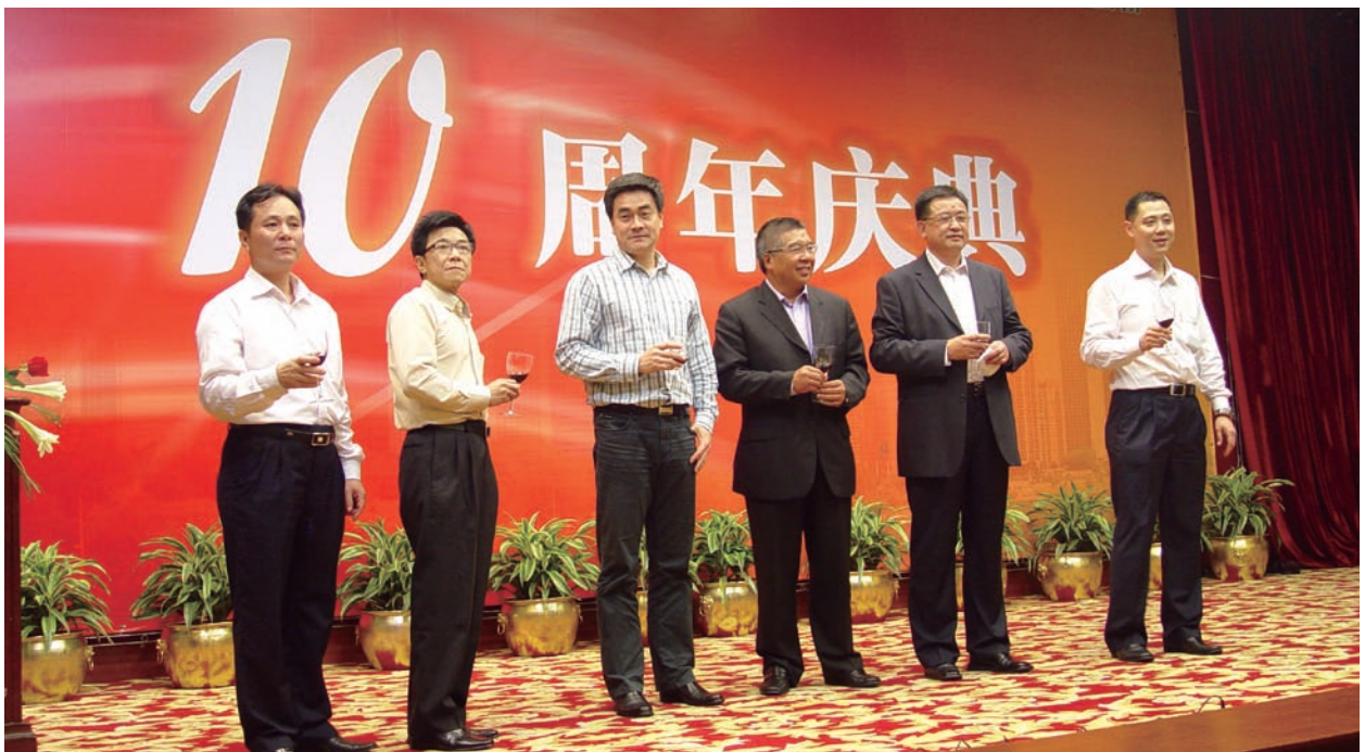
廣州新時代管理層慶祝10周年慶典