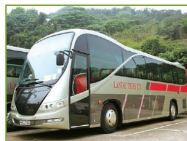
大嶼旅遊的新型號巴士

於二零零九年三月三十一日，環島擁有經營177輛(二零零八年：166輛)豪華轎車的車隊，其中53輛(二零零八年：50輛)擁有跨境服務牌照。環島已擴大此豪華轎車車隊，主要為機場、本地及跨境(往返廣東省)提供貴賓式豪華接送服務。此外，「環島旅運」為環島的旅行社部門，負責營辦前往海洋公園及迪士尼樂園的本地旅行團，其業務亦包括銷售機票及其他旅遊套票。