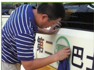
廣州二巴董事長帶領了文明巴士運動。

於二零零九年三月三十一日，該附屬公司由本集團擁有56%(二零零八年：56%)，共有19輛(二零零八年：19輛)巴士於廣東省內經營5條(二零零八年：5條)長途巴士路線。年內，本公司應佔溢利約為6,100,000港元(二零零八年：6,000,000港元)。該附屬公司的業績相對穩定。