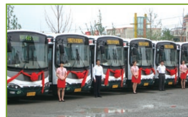
重慶冠忠(新城)在展示新巴士車隊的面貌

於二零零九年三月三十一日，該附屬公司由本集團擁有42.15%（二零零八年：42.15%）實際權益，在重慶經營29條（二零零八年：29條）巴士路線，車隊共有681輛（二零零八年：626輛）巴士。年內，本公司應佔溢利約為11,400,000港元（二零零八年：7,700,000港元）。溢利上升，主要由於政府津貼增加，加上受惠於其在重慶北部迅速發展地區經營巴士路線，故擴充了車隊所致。