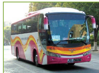
環島旗下一輛跨境巴士正在廣東新會線上行走

本集團在香港的專利巴士業務由本集團擁有99.99%權益的附屬公司新大嶼山巴士(一九七三)有限公司(「嶼巴」)提供。於二零零九年三月三十一日，嶼巴主要在大嶼山經營23條(二零零八年：23條)專利巴士路線，巴士車隊總數為104輛(二零零八年：97輛)。截至二零零九年三月三十一日止年度，嶼巴的總營業額約為94,800,000港元(二零零八年：93,900,000港元)，並錄得虧損約為35,000港元(二零零八年：溢利約4,900,000港元)。