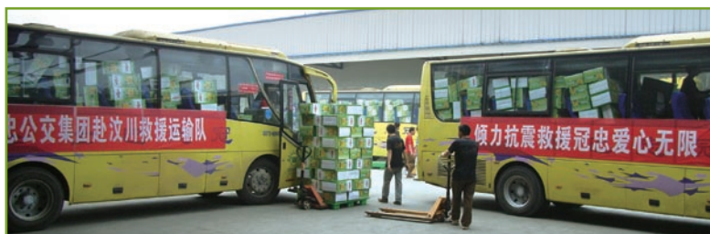
於「五一二」四川地震後重慶冠忠公共交通組成了救援運輸隊伍

於二零零九年三月三十一日，該附屬公司由本集團擁有30.25%（二零零八年：30.25%）實際權益，在重慶南部經營76條（二零零八年：76條）巴士路線，車隊共有937輛（二零零八年：930輛）巴士。年內，本公司應佔虧損約為1,200,000港元（二零零八年：4,100,000港元）。去年，該附屬公司已就旗下一輛行駛中的巴士發生嚴重火警支付賠償淨額（已扣除保險索賠金額）約達人民幣6,500,000元（本公司應佔部分：2,200,000港元）。