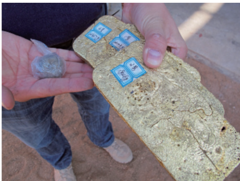
圖一—金條(右)產自敖漢旗選廠的天然金混汞

據此前的報告，日產500噸之第一階段基礎設施——敖漢旗的選礦設施，在該項目於2010年7月1日被完成收購後，僅僅在四個月的時間裡就已完工。選廠設備、配套設備和第一階段的尾礦庫，也得以安裝和完工。敖漢旗選礦廠正式的開業典禮於2010年11月20日舉行，當地政府有關人員出席了這次開業典禮。