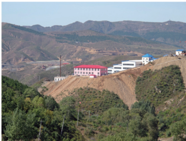
圖二 – 擴大中之敖漢旗選廠設施

根據之前的報告，該選廠在2010年12月底達到了每日500噸的全額處理能力。不過，由於之前提及過之安全改造施工，當前的採礦量已短期被限制，而按本公司的採礦計劃，要達到預期的生產品位而開採主礦體的生產計劃亦有所延遲。但為了測試選廠設備和運營情況，選礦廠的原料從今年一月開始由擴大採礦工作區域期間之矸石來代替。本公司很高興向大家報告，此階段的安全改造施工已於2011年8月12日完工，成本支出約人民幣500萬元，包括巷道支護系統的修復、巷道的改造、通風條件的改善、設備的升級等。選礦廠於9月20日重新投入運營，要達到日產500噸之產能，提升時間大約為三至四周。辦公樓等附屬設施及尾礦庫的升級和擴大亦正在進行中。